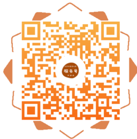
北京中医药大学财务处服务号